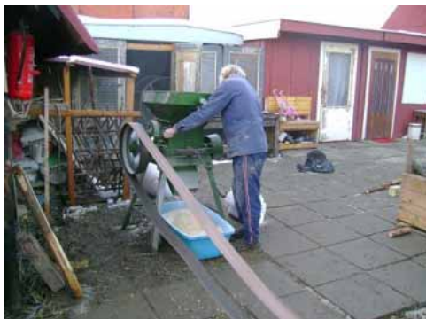
... rôzneho druhu