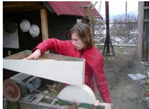
... príprava surovín