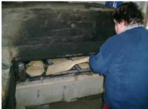
... prvé pokusy s novou pecou