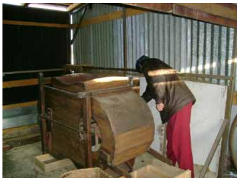
... rôznymi zariadeniami