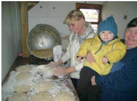
... radosť z prvých bochníkov