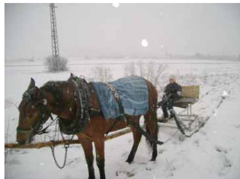
... nakoniec i trochu relaxu aj pre deti