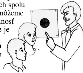
Dajte mi čas a peniaze a ja presvedčím všetkých, že tento čierny kruh je biely štvorec.

● Špenát je mimoriadne bohatý na železo. Špenát neobsahuje vôbec viac železa ako iné potraviny. Varený špenát obsahuje 2,2 mg železa, biely chlieb 2,3 mg, fazuľa a sója 2,7 mg, mandle 4,6 mg a pistácie dokonca 7,3 mg/100g. Táto legenda podporená reklamou o námorníkovi Pepekovi vznikla chybou - posunom desatinnej čiarky o jedno miesto napravo. Na chybu sa prišlo už v 30. rokoch, no mýtus o železe v špenáte sa udržal dodnes.