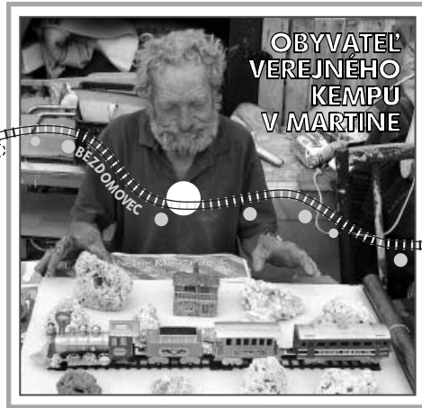
minulosť... PRÍTOMNOSŤ ...budúcnosť

Život človeka, ktorý sa narodí na tejto planéte, sa dá prirovnať ku ceste vlakom. Táto cesta je plná príjemných prekvapení, ale i smútku. Začína sa naším nastúpením a končí vystúpením z vlaku. Narodením nasadáme do vlaku a stretávame tam osoby, s ktorými by sme si priali zostať počas celej cesty: našich rodičov. Ale pravda je iná. Oni na nejakej stanici vystupujú, zbavujúc nás svojej citlivosti, priazne a nenahraditeľného sprevádzania. To ale neprekáža tomu, aby nastúpili iné osoby, ktoré sa pre nás stanú veľmi dôležitými. Prichádzajú naši bratia, priatelia a zázračné lásky. Medzi osobami, ktoré cestujú týmto vlakom, sa nájdu i také, ktoré sa prišli len previezť. Také, ktoré pri cestovaní vyvolávajú len smútok... Ale tiež také, ktoré chodia po vlaku a sú pripravené pomôcť tomu, kto to potrebuje. Mnohí po vystúpení zanechávajú clivosť... Iní prejdú tak nepozorovane, že si ani neuvedomíme, kedy uvoľnili miesto. Niektorí cestujúci, ktorých najviac milujeme, obsadia miesta vo vagónoch, ktoré sú najďalej od toho nášho. Preto budeme musieť prejsť našu cestu bez nich. Samozrejme, nič nebráni tomu, aby sme sa počas cesty poobzerali po našom vagóne a vybrali sa k nim... Ale už si nebudeme môcť sadnúť vedľa nich, lebo toto miesto už bude obsadené inou osobou. Nevadí; táto cesta vyzerá práve takto: plná výziev, snov, fantázie, očakávaní, stretávaní a rozlúčok... Ale nikdy návratov. Preto absolvujeme našu cestu