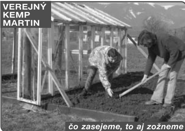
čo zasejeme, to aj zožneme