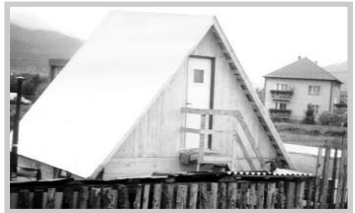
Takéto chýtky pomáhajú bezdomovcom žiť ako ľudia