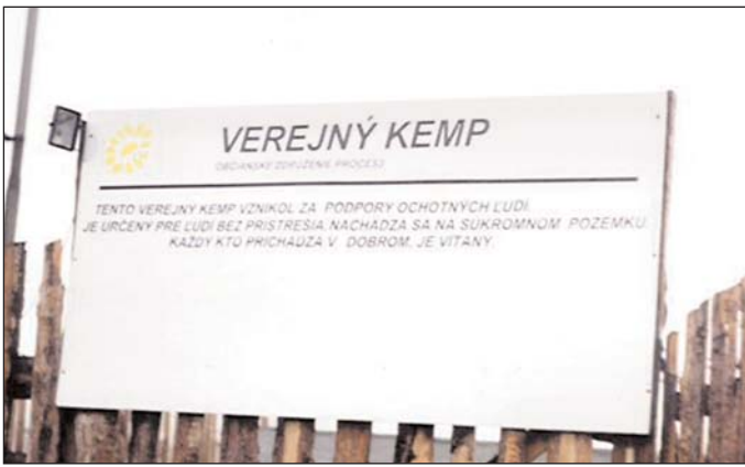
Táto tabuľa vás víta pri vstupe do Verejného kempu