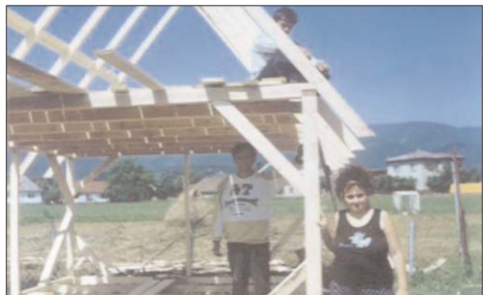
Výstavba druhej oteplenej chatky