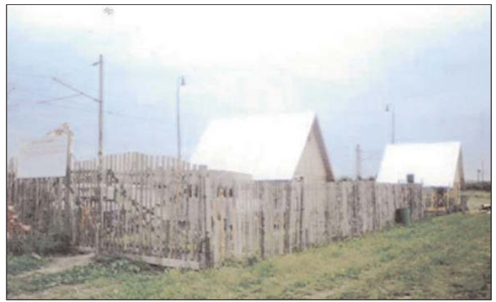
K prvej chatke pribudla ďalšia oteplená chatka