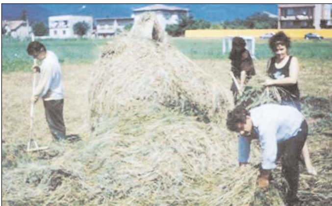
Obyvatelia Verejného kempu pri hrabaní sena