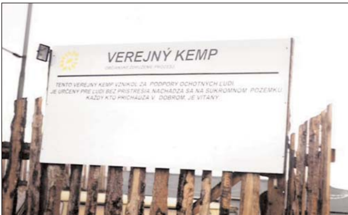
Táto tabuľa vás víta pri vstupe do Verejného kempu