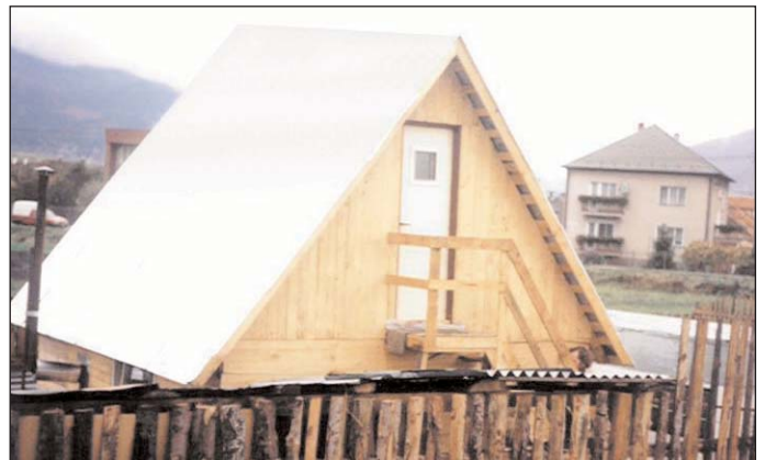
V tejto chatke na území Verejného kempu žije pár obyvateľov