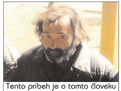
Tento príbeh je o tomto človeku

znania. Tí nič nevyčítajú. Len tie alkoholické-okenové prebúdzania. Tie sú rovnako desivé a strašidelné, ako keď do vás dobiedza niekto z blízkych. Vtedy chceš byť ako iní, chceš, aby si ťa ľudia vážili. Nikdy som neprijal osud bezdomovca, túlať sa s rozbitou hlavou pomedzi kontajnéry. Tie pohľady, to povýšené ľudské ego, ktoré na vás hľadí spoza záclon. Keď cítiš tieto pohľady, bolí to. Strašne to bolí! Hľadáš fľaše. Ešte jednu nájsť, bude zase Modrá. Moja modrá Okená je asi jediné čo milujem. Priložíš k ústam a za chvíľku necítiš pohľady za oknami. Vtedy si uvedomíš, že svet je krásny, aj keď upotácaný.