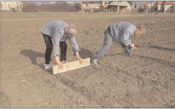
Obyvatelia kempu pri sadení poľnohospodárskych plodín