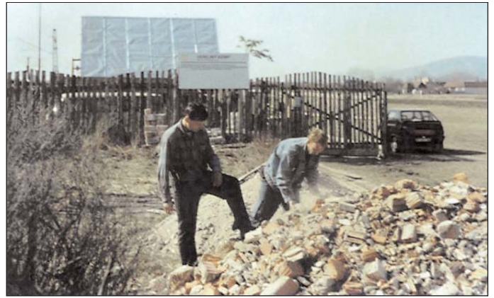
Obyvatelia kempu pri čistení starých tehál