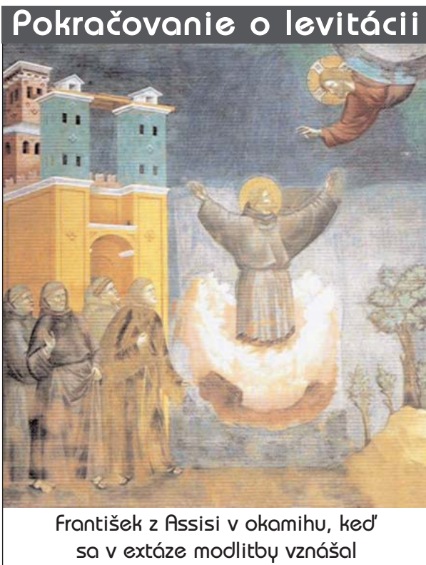
František z Assisi v okamihu, keď sa v extáze modlitby vznášal

Nabudúce si povieme, ako sa dá prakticky zvládnuť jedna z foriem levitácie. Napíšte, čakáme na vaše fantastické otázky.